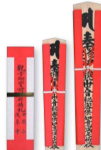
紅札(紙札/小木札/大木札)