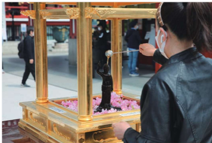
甘茶が灌がれている様子

堂内や参道にしつらえた花御堂の「誕生仏」には、参詣者により供養の甘茶が灌がれます。